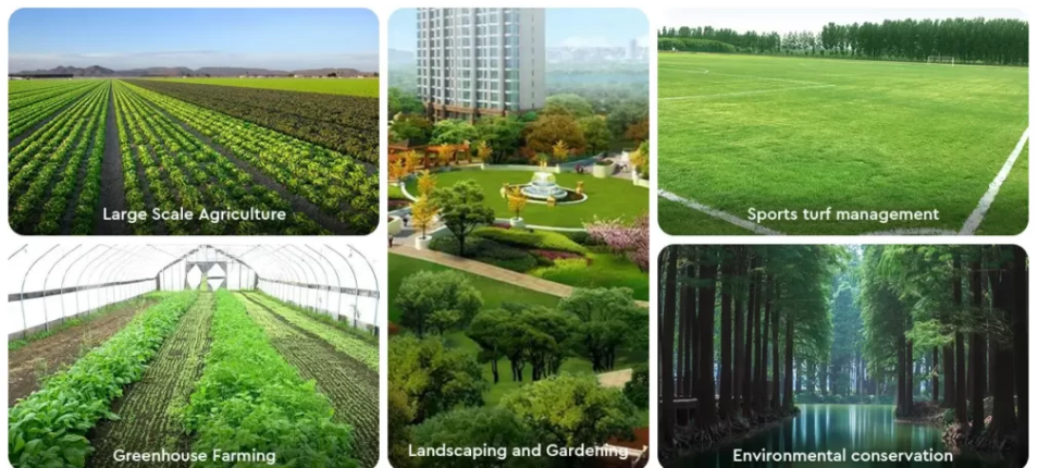
Benefits of installing LoRa soil moisture sensor

Los agricultores de hoy están desesperados por obtener datos que les permitan tomar decisiones precisas sobre el riego y la fertilización para optimizar el rendimiento de sus cultivos. Cuando todo lo demás sigue igual, la humedad del suelo es el factor principal que puede aumentar el rendimiento de los cultivos. Una vez que un agricultor puede controlar la humedad del suelo, puede maximizar los rendimientos de los cultivos a pesar de las limitaciones climáticas y de cultivos. El módulo LoRa de bajo consumo admite la recopilación de información del suelo, como la humedad y el pH, y transmite todos los datos a la puerta de enlace LoRa. Luego, la puerta de enlace lo envía a un servidor remoto o local para crear el entorno óptimo para el crecimiento de los cultivos.